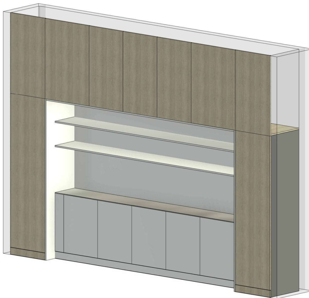
BALDO SP.5 VAIZDAS 3D